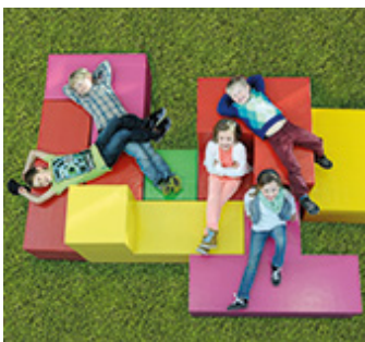
Sitzelement CUBUS LINE