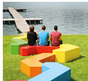
Sitzelement CREATIVE LINE